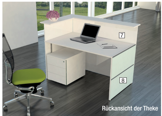
Rückansicht der Theke

Als Zubehör gibt es Taschenablagen und je Thekenvorbau eine LED-Leuchte, die unterhalb der Aufsatzplatte montiert wird. Als Stauraum dient ein Rollcontainer mit drei Schublen. Auf den folgenden Seiten wir Thekenanlagen als Beispiele abgebildet.